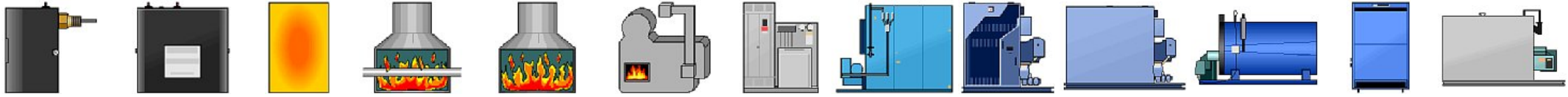
Boiler control 2 Boiler control 3 Boiler symbol Boiler with flames and a pipe Boiler with flames Boiler with small fire Electric hot water and steam boiler Firebox boiler Flexible water tube boiler (cutaway) Flexible water tube boiler Four-pass boiler Gas-fired boiler 1 Gas-fired boiler 2