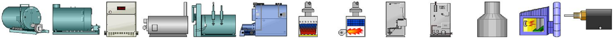
Boiler (perspective view) Boiler 1 Boiler 10 Boiler 11 Boiler 2 Boiler 3 Boiler 4 Boiler 5 Boiler 6 Boiler 7 Boiler 8 Boiler 9 Boiler control 1